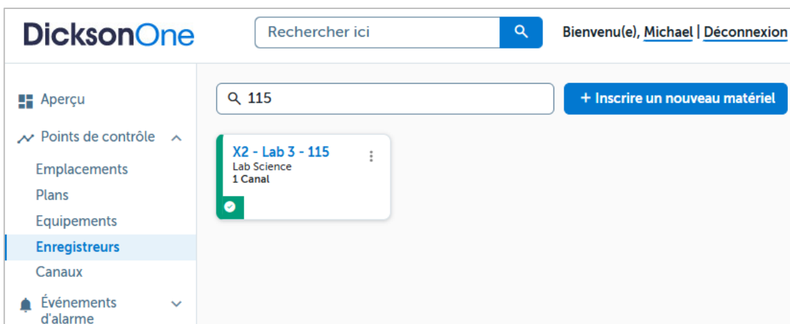
Figure 4 – Accédez à l'enregistreur via le menu Points de Contrôle dans DicksonOne.

L'enregistreur apparaît dans le tableau de bord. Les données commenceront à être transmises automatiquement au système dans un délai maximum de dix minutes.