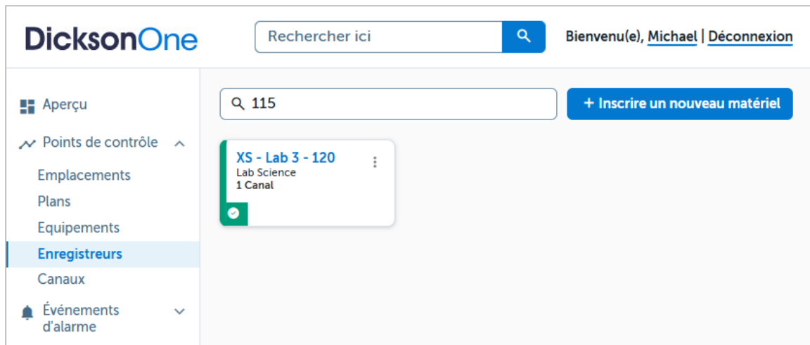
Figure 4 – Accédez à l'enregistreur via le menu Points de Contrôle dans DicksonOne.

Nous vous invitons à prendre connaissance de la documentation DicksonOne afin de tirer le meilleur parti de vos produits Dickson.