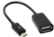
Câble USB OTG

Note : Les enregistreurs RFL fonctionnent sur piles, mais vous pouvez également les alimenter en même temps avec un adaptateur secteur (réf. A075) et des piles AA. La combinaison des deux sources d'alimentation présente l'avantage de prolonger l'autonomie des piles AA lorsque l'adaptateur secteur est branché.