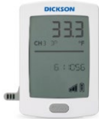
Enregistreur RFL et capteur remplaçable

Votre capteur peut varier par rapport à cette image